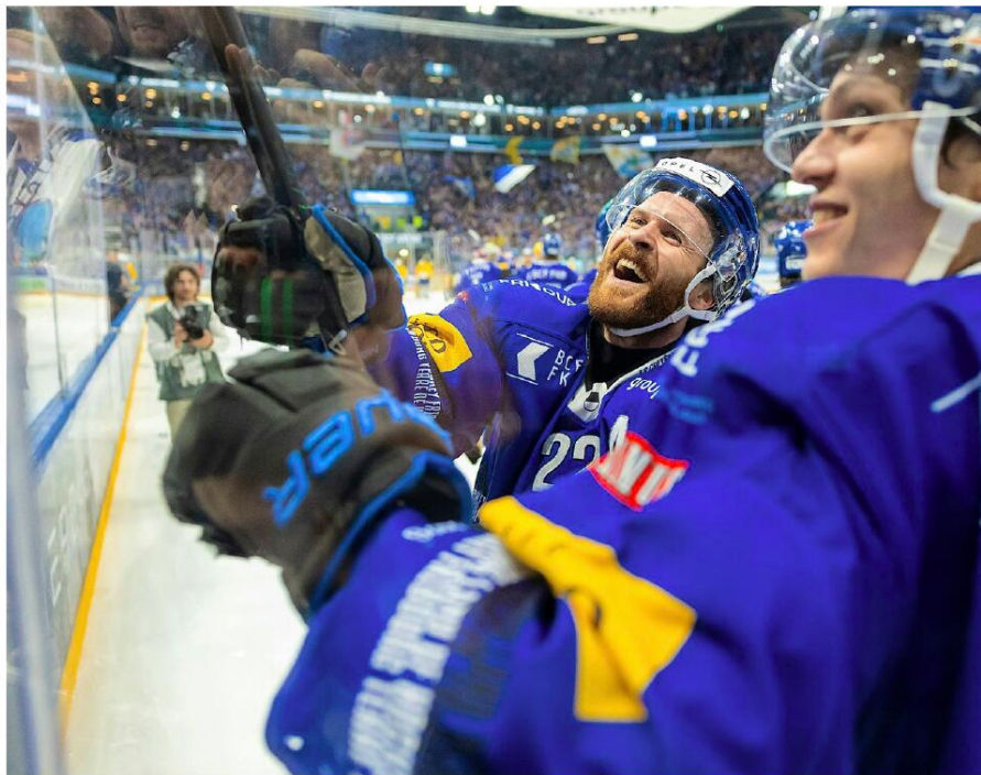
Les joueurs de Gottéron Bertschy (à g.) et Biasca jubilent avec leur public. Ils ont gagné le droit de disputer un acte VII.

GOTTÉRON Fribourg reste en vie dans la cinquième finale de play-off de son histoire en National League. Hier soir, les Dragons ont fait chavirer la BCF Arena