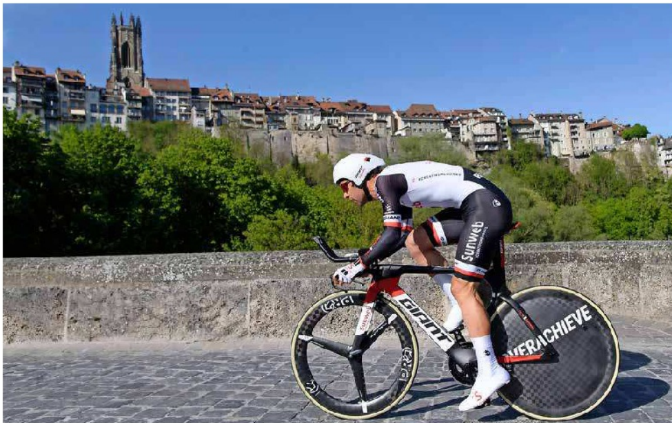
L'Australien Michael Matthews s'est montré le plus rapide hier après-midi lors du prologue du Tour de Romandie dans les rues de Fribourg.

CYCLISME La petite reine a fait le bonheur de plusieurs milliers de spectateurs hier en ville de Fribourg à l'occasion du prologue du Tour de Romandie. Sous un magnifique soleil et sur un parcours de quatre kilomètres, l'Australien Michael Matthews s'est imposé devant le Suisse Tom Bohli. Le Slovène Primož Roglič a terminé à la troisième place. >> 18/19